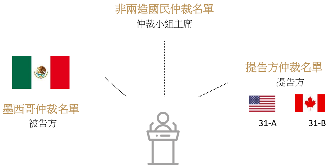
圖表 3. 快速回應勞工仲裁小組之成員

D 前述挑選成員係透過抽籤方式進行，而每一仲裁小組將由提告方（加拿大或美國）仲裁名單選出 1 名成員，另 1 名成員則從被告方(墨西哥)仲裁名單選出，第 3 名成員則由非兩造國民仲裁名單選出，並擔任該仲裁小組主席一職。