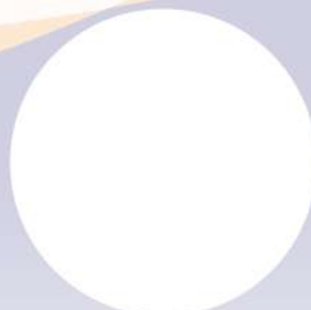
中國砂輪企業股份有限公司代表 待定 董事長